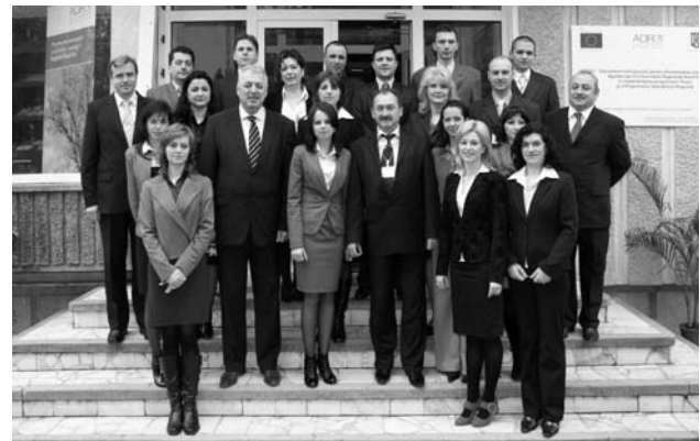
Diracția Organism Intermediar POR

Din nou, alte voci se întrebă dacă vom reuși să terminăm ceea ce am început, întrucât sunt multe lucruri care se vor constitui în piedici: licitații, constructori, resurse umane de calitate, cofinanțări. Noi avem răspunsul - credem în continuare. Credem că proiectele promovate pentru dezvoltarea centrelor urbane, pentru reabilitarea drumurilor județene, a rețelelor stradale din câteva orașe ale regiunii, pentru dezvoltarea durabilă a mediului de afaceri și a turismului regional, pentru structurile de sănătate, servicii sociale și învățământ, se vor bucura de succes. Și noi asemenea inițiatorilor și beneficiarilor lor. De aceea avem dreptul de a ne mândri. Și nu avem motive să nu o facem.