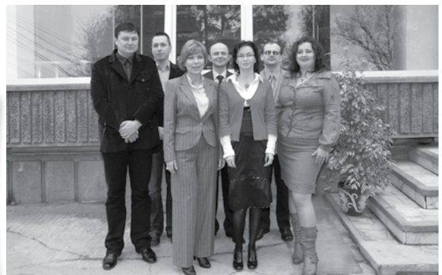
Direcția Planificare, Programare