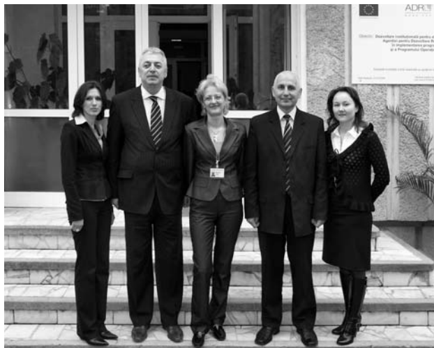
Diracția Juridică și RU

ADR NE este o instituție care înțelege că oamenii sunt importanți, propunându-și în acest sens să investească constant în pregătirea și dezvoltarea profesională a resursei umane pentru a obține performanță în îndeplinirea obiectivelor organizației.