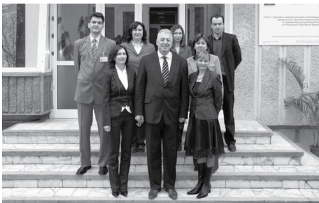
Direcția Comunicare și Promovare Regională

În timp numărul angajaților din această direcție a crescut de la 3 la 9. Avem o echipă tânără (media de vârstă este 33 ani). Ne mândrim cu proiectele noastre, cu imaginea pe care am creat-o despre organizația în care lucrăm și respectul câștigat din partea colaboratorilor fără de care nu am fi putut aniversa astăzi 10 ani de activitate.