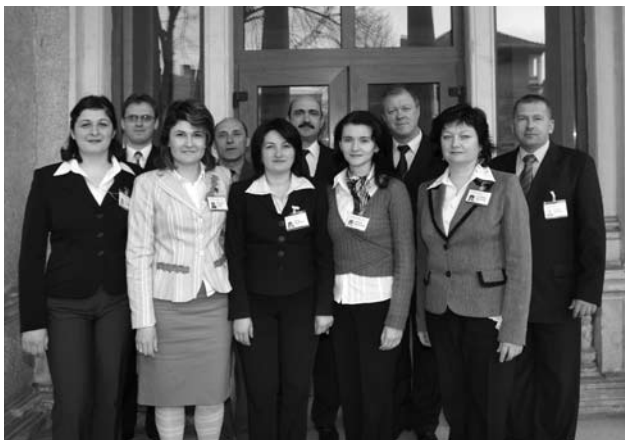
Direcția Programe Phare și Românești

Începutul a fost făcut cu Phare CES 98, unde au fost contractate și implementate 136 proiecte. A fost chiar un început și ca orice început nu a fost unul ușor. Nu exista experiența și expertiza necesare, nici la nivel regional și nici la nivelul ministerelor. Atunci au fost stabilite pentru prima oară regulile și procedurile necesare pentru contractarea și implementarea unei scheme de finanțare. Colegii noștri de atunci au fost pionierii dezvoltării regionale. Atunci au fost puse bazele activității ADR Nord-Est din punctul de vedere al evaluării, contractării și implementării